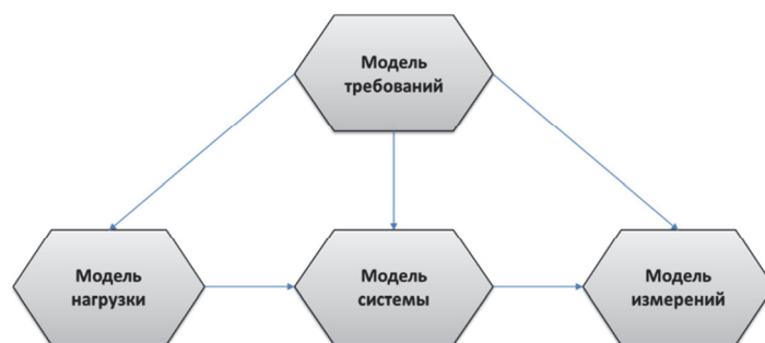
Рис. 1. Модели в нагрузочном тестировании.

На основе метамodelей формируются соответственно модели требований, системы, нагрузки и измерения (рисунок 1). В модели требований представлены требования к системе, состоящие из бизнес-правил и технических требований. В модели системы указаны устройства объекта тестирования, программные комплексы, связи между комплексами, связи комплексов с устройствами объекта тестирования. В модели нагрузки представлены функции для распределения нагрузки, матрица потоков нагрузки и интерфейсы для ввода нагрузки (в виде ссылки на модель системы). В модели измерений указаны измеряемые величины для каждого типа устройств системы, периодичность и скважность измерений, расчетные показатели и взаимосвязь с измеряемыми величинами, правила и алгоритмы получения расчетных показателей, типовые критерии оценки полученных результатов.