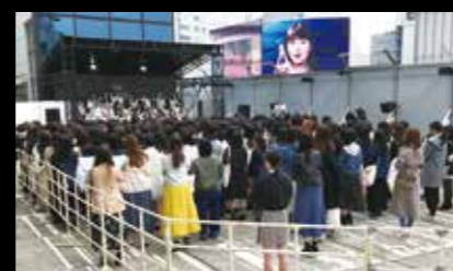
イベントスペース (MAGNET by SHIBUYA109屋上)