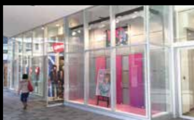
大型ショーウィンドウ (SHIBUYA109阿倍野)