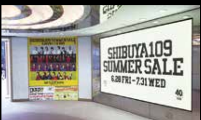
大型サインージ (SHIBUYA109エントランス)