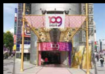
イベントスペース (SHIBUYA109店頭)