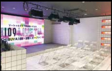
LIVE TV ハチスタ (SHIBUYA109 8階)