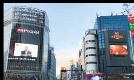
大型ビジョン (スクランブル交差点)

SHIBUYA109館内外のメディアをはじめ、スクランブル交差点の大型ビジョンや大型懸垂幕・駅地下・イベントスペース、大阪の天王寺駅周辺メディアなど、各種メディアを活用した立体的なプロモーションが実施可能!これにより、イベント性やブランディング効果を飛躍的に高めることができます。 ※事例の一部は有料、要審査媒体となります