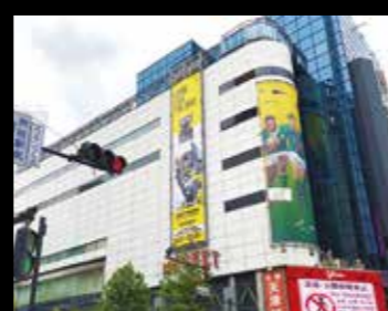
大型懸垂幕 (MAGNET by SHIBUYA109)