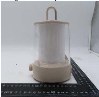
Immagine a colori del prodotto: