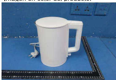
Imagen en color del producto:

Zhang Fengcheng / Certification Engineer