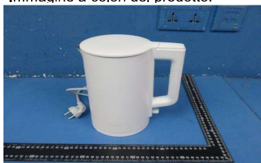
Immagine a colori del prodotto:

Zhang Fengcheng / Certification Engineer