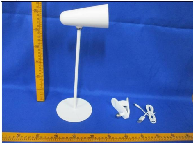
Immagine a colori del prodotto: