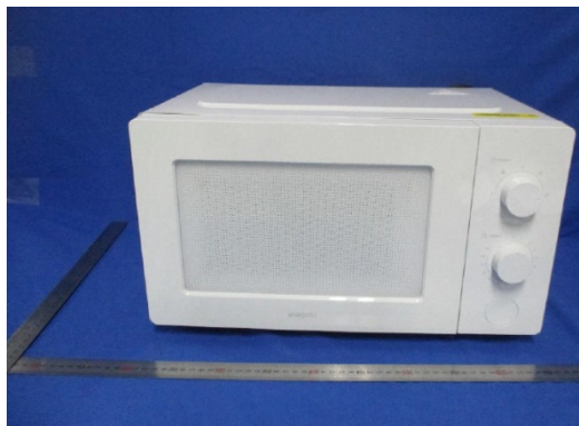
Imagem a cores do produto: