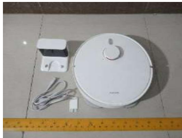
Imagen en color del producto: