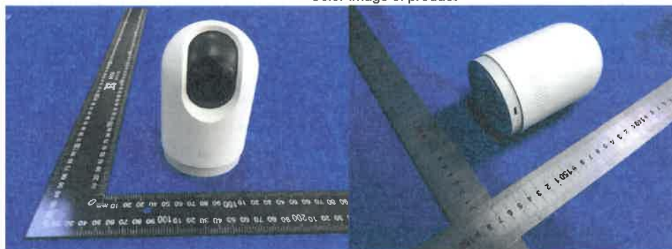
Color Image of product