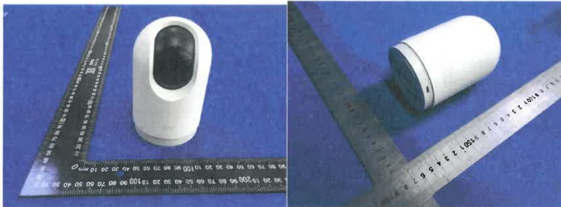
Color Image of product