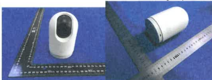
Color Image of product