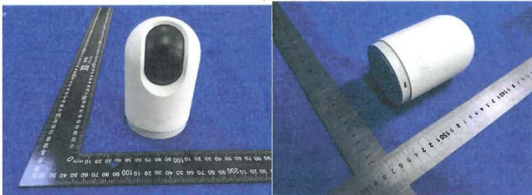
Color Image of product