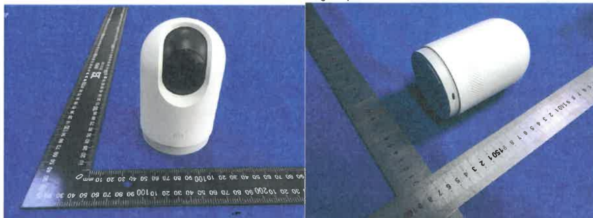
Color Image of product