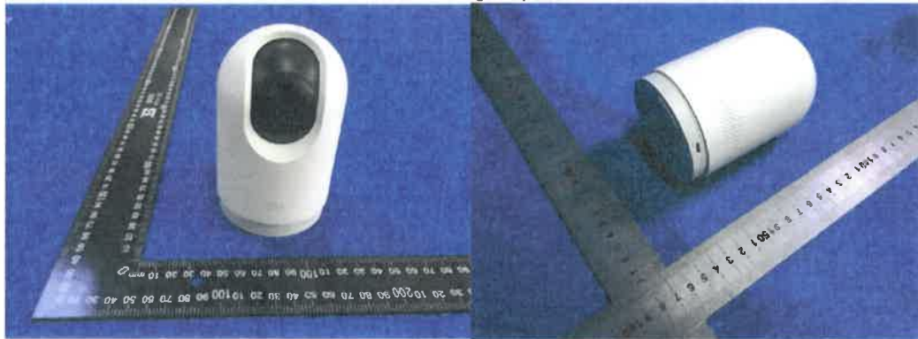
Color Image of product