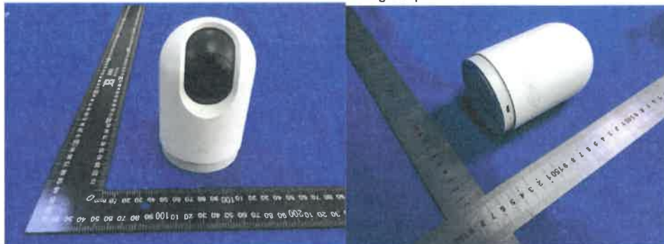
Color Image of product