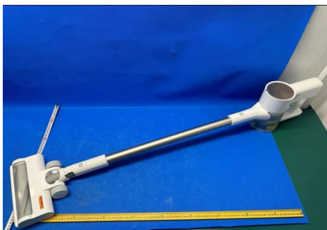
Imagem a cores do produto: