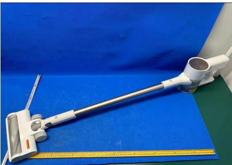
Imagen en color del producto: