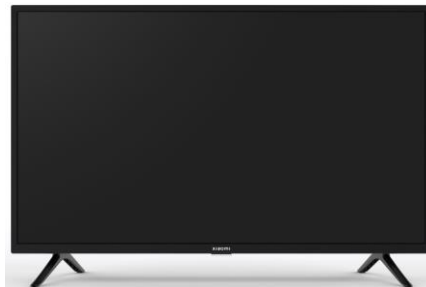
Imagen en color del producto: