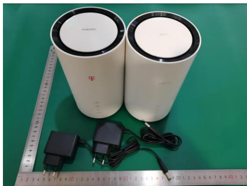
Imagem a cores do produto: