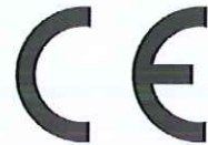
Image en couleur du produit