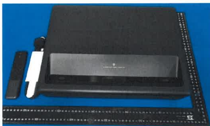
Imagem a cores do produto: