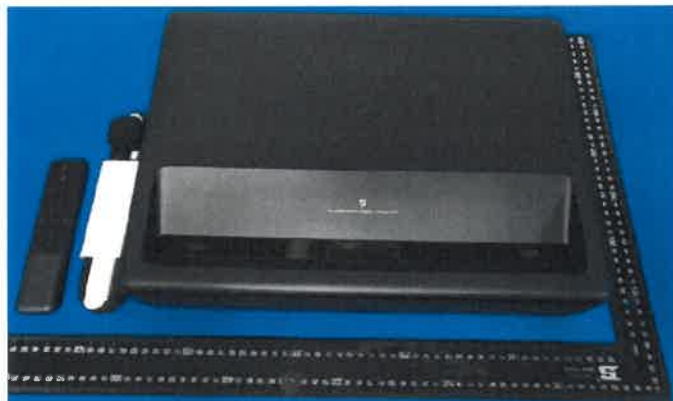
Immagine a colori del prodotto: