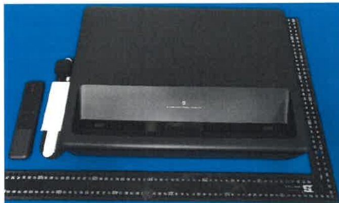
Imagen en color del producto: