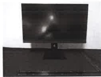
Imagen en color del producto: