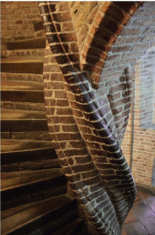
Fotograaf: Farlukar Wenteltrap van het Prinsenhof in Delft