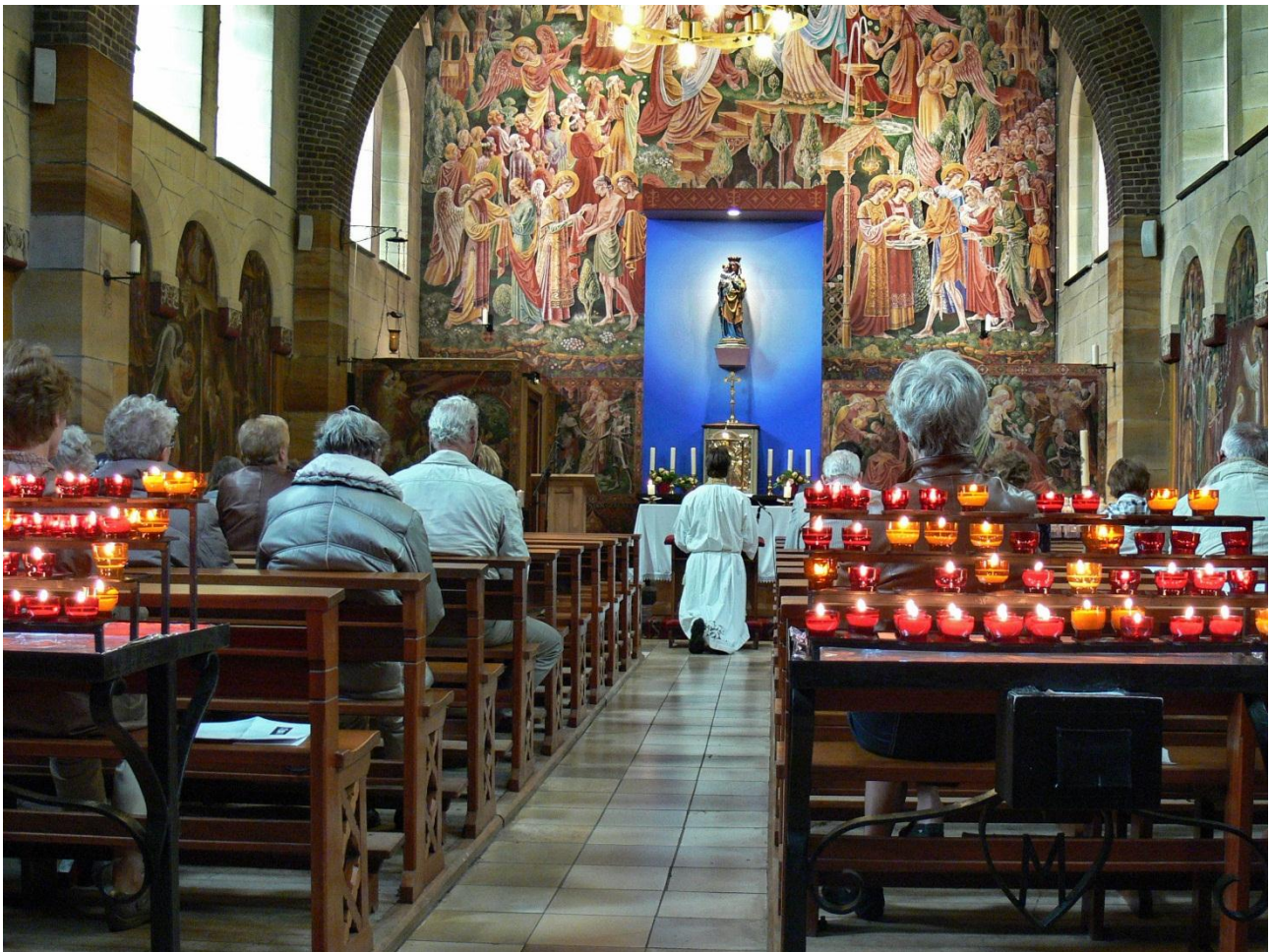
Onze-Lieve-Vrouwe-ter-Noodkapel in Heiloo

Lijkt een echt Limburgs plaatje, maar staat in Noord-Holland. Sfeervolle foto. Zegt daardoor ook iets minder over het monument, maar meer over het gebruik ervan. Foto met een interessant verhaal.