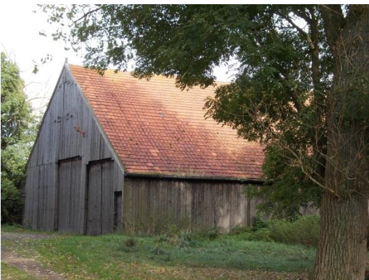
Bijschuur bij Hamdijk 49 in Oldambt

Mooie foto van de boerderijsfeer met pontificaal monument.