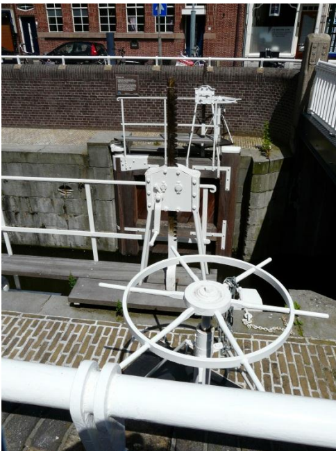
Fotograaf: Asibbes Donkere Sluis, Gouda

Foto is genomen met scherp en helder licht hetgeen van de foto straalt.