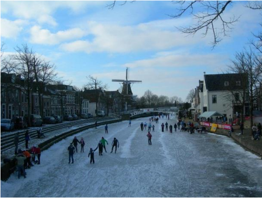
Schaatsplezier bij De Hoop in Dokkum

Nederlands schaatsplezier onder een molen.