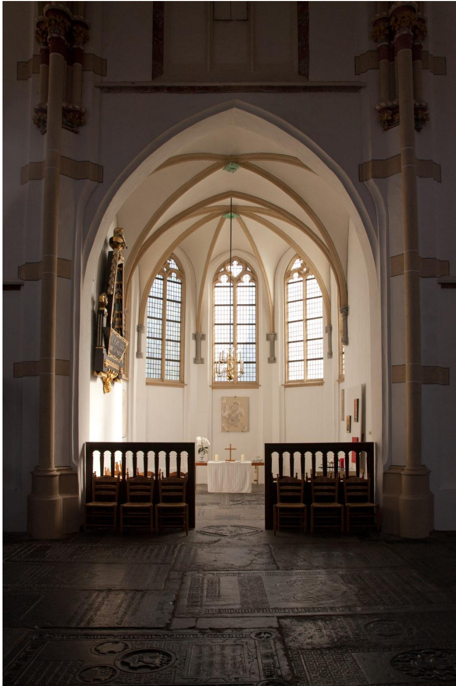
Nis van de Grote of Sint-Maartenskerk in Zaltbommel

Bij deze foto geldt: Hoe langer je ernaar kijkt hoe mooier de foto wordt. Door de prachtige lichtval komen zowel de nis als de details van de graven op de vloer mooi naar voren. Een leuk idee met een goede uitvoering. Sfeervol, niet gekunsteld, veel evenwicht en voelt natuurlijk.