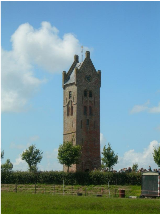
Toren op het kerkhof van Firdgum