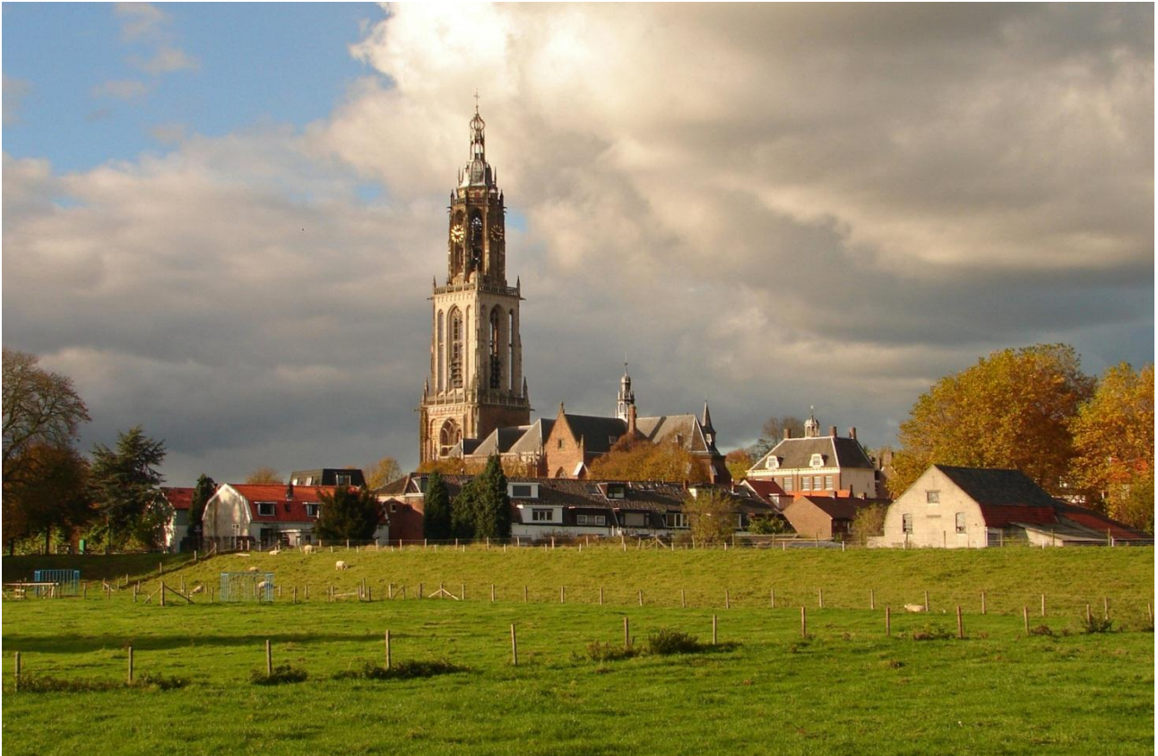
Cunerakerk in Rhenen

Mooie lichtsituatie, interessante lucht. Overbelichting bij de schuur aan de rechterkant die door sommigen mooi gevonden wordt, en ander juryleden een beetje irriteert. De schaaapjes geven een gezellige indruk. De kerk steekt fier boven de stad uit en bepaald het gezicht vanaf de uiterwaarden. De omgeving voegt goede context toe.