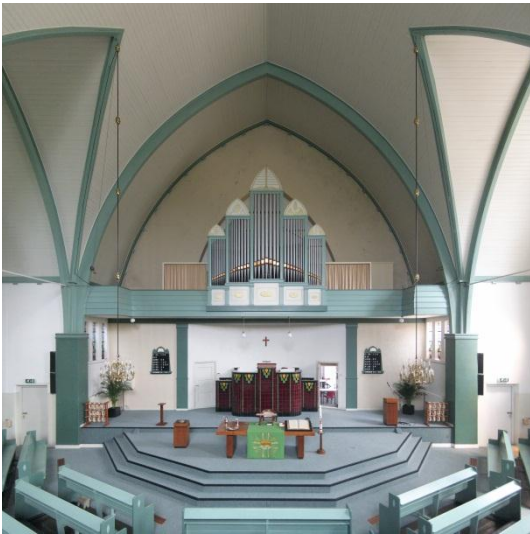
Interieur van de Noorderkerk van Nieuw-Amsterdam

Strakke en zeer degelijke interieurfoto.