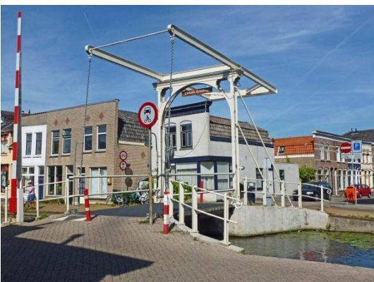
Ketelbrug in Gouda

Het spel tussen de rode onderdelen in de foto en de witte brug is erg leuk.