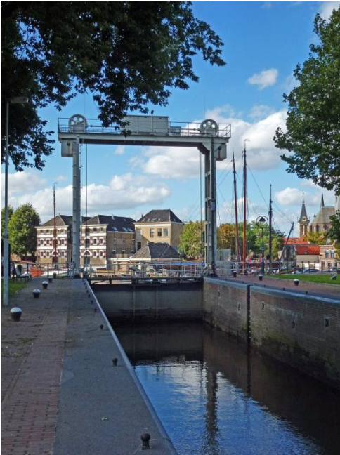
Fotograaf: Agaath Mallegatsluis, Gouda

Scherpe en heldere foto, omkadering door helder blauwe lucht en groen gebladerte. Het beeld 'leest' van rechtsonder naar links in het midden: beweging naar de monumenten op de achtergrond. Er zit beweging en dynamiek in de foto. Veel te zien op de foto, de sluis op de voorgrond en de verschillende monumenten op de achtergrond. Twee interessante lagen.