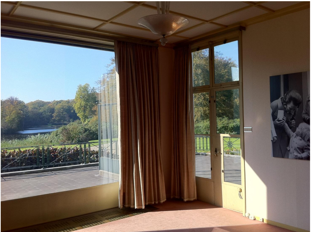
Kamer van koningin Juliana in Paleis Soestdijk

Geweldige foto. Sfeervol, en hoewel het interieur grotendeels weg is, geeft het een prachtig inkijkje in het paleisleven: hoewel het een paleis is, ziet het er eenvoudig uit. De foto straalt spruitjesgeur en Hollandse zuinigheid uit. De foto van Beatrix op de muur net meegenomen op de foto biedt iets extra's. De foto is een beetje scheef, maar dat voegt ook wel iets aan de charme toe.