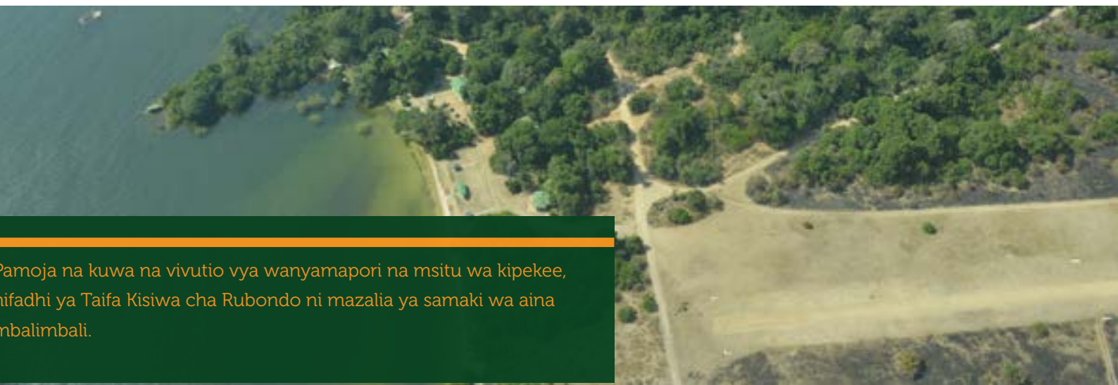
Pamoja na kuwa na vivutio vya wanyamapori na msitu wa kipekee, uhifadhi ya Taifa Kisiwa cha Rubondo ni mazalia ya samaki wa aina mbalimbali.

Hata hivyo, vikundi hivi vimekuwa vikikumbwa na changamoto mbalimbali, hasa ukosefu wa mitaji kwa ajili ya kununua mafuta ya kufanyia doria. Wajumbe wa BMU ambao ndio hufanya doria za mara kwa mara hukosa motisha, baadhi kujihusisha na vitendo vya ujangili kwa kushirikiana na wahalifu. Pia kuna upinzani kutoka kwa baadhi ya wavuvi haramu ambao wamekuwa wakijinufaisha na uvuvi haramu.