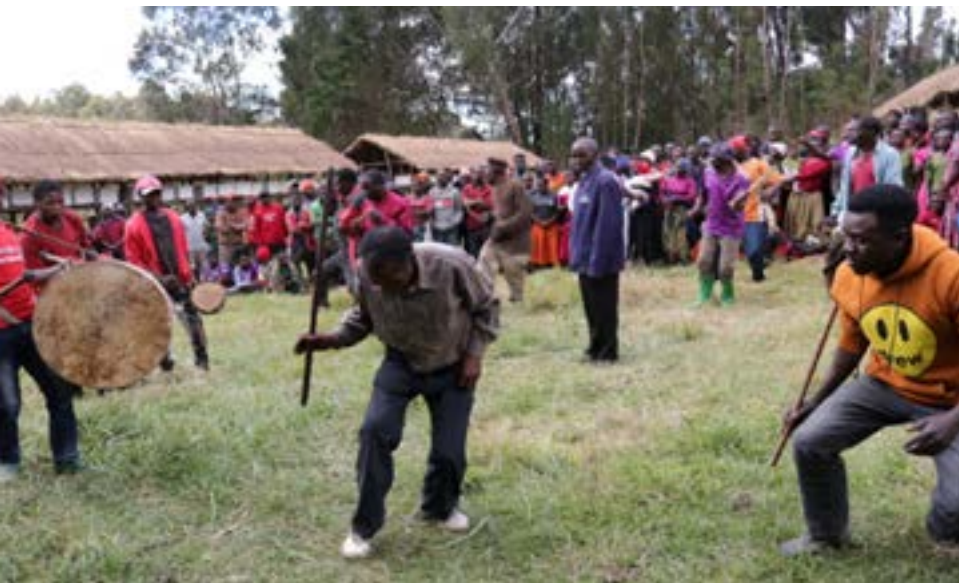
Burudani zikiendelea wakati wa uzinduzi wa Mradi wa ufugaji nyuki kijiji cha Kinyika

maji katika mto Ruaha na hatimaye kwenye Mradi wa ufuaji wa umeme wa Bwawa la Nyerere (Stigler`s Gorge), lakini pia utasaidia wananchi kutambua thamani halisi ya maliasili na hivyo kuzilinda, ikiwa ni pamoja na kuongeza juhudi katika kuzitunza,” anasema mwenyekiti huyo.