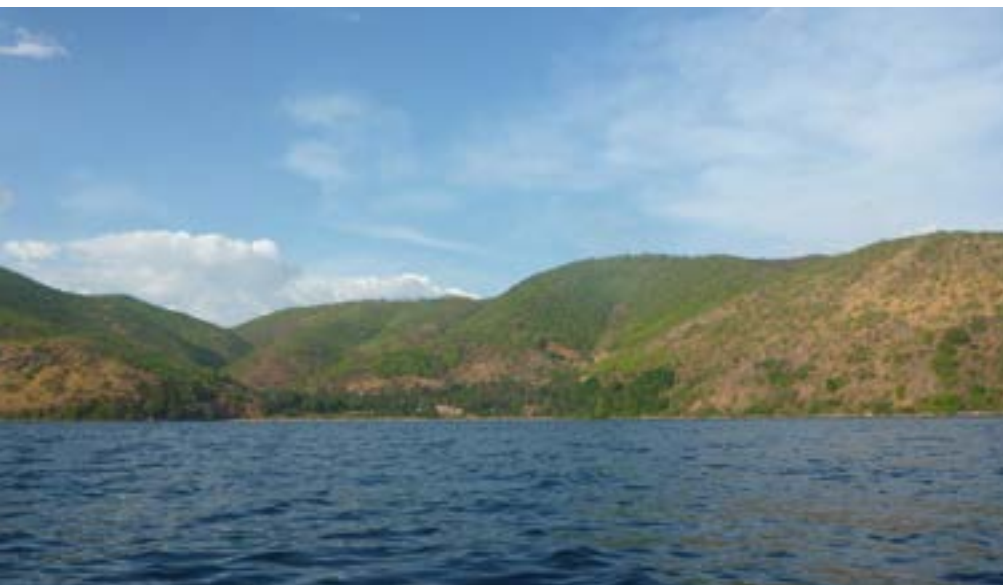
Picha ya Msitu wa kijiji cha Kigalye mwaka 2020

Baada ya kupewa mizinga 20 ya ufugaji nyuki sasa waeanza kujikita katika uzalishaji asili ikiwa ni shughuli mbadala na wana matumaini ya kupata kipato cha