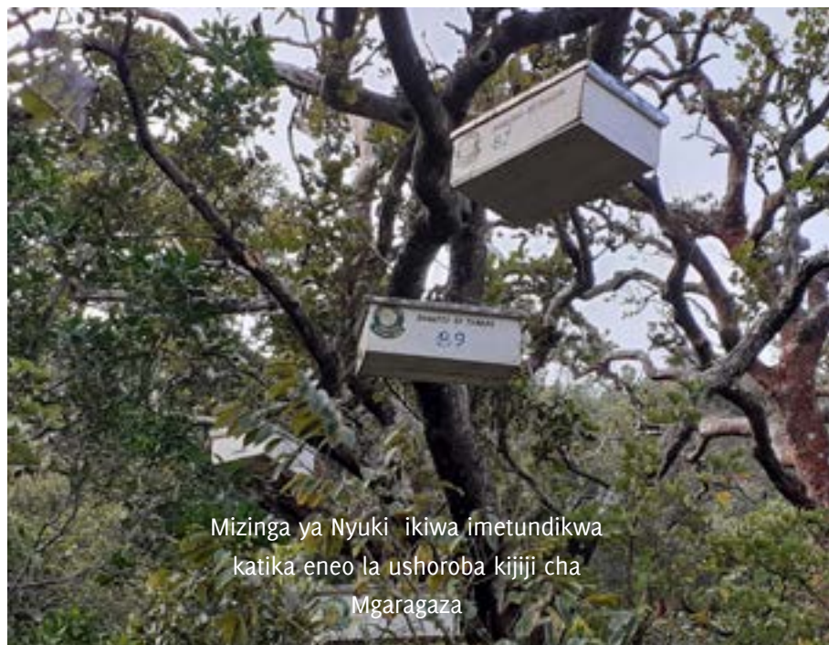
Mizinga ya Nyuki ikiwa imetundikwa katika eneo la ushoroba kijiji cha Mgaragaza

Uvunaji wa miti kwaajili ya kuchoma mkaa