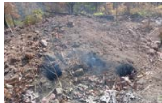
Tanuru la Mkaa ndani ya eneo la ushoroba